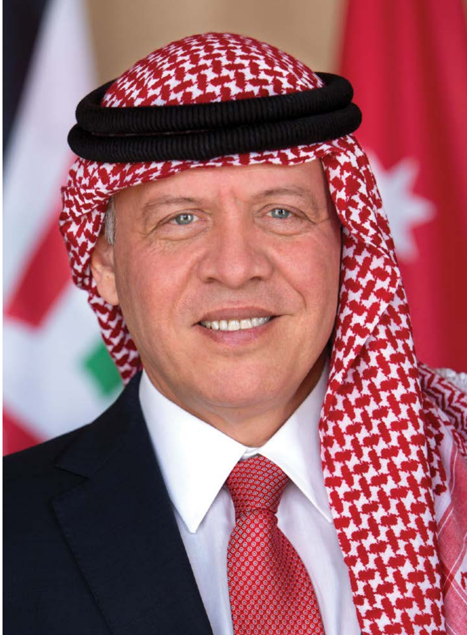
حضرة صاحب الجلالة الهاشمية الملك عبدالله الثاني ابن الحسين المعظم