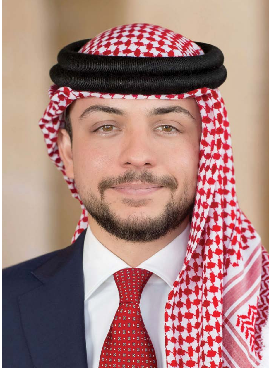
حضرة صاحب السمو الملكي الأمير الحسين بن عبدالله الثاني المعظم ولي العهد